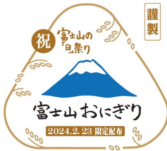
「富士山の『日』祭り」ポスター